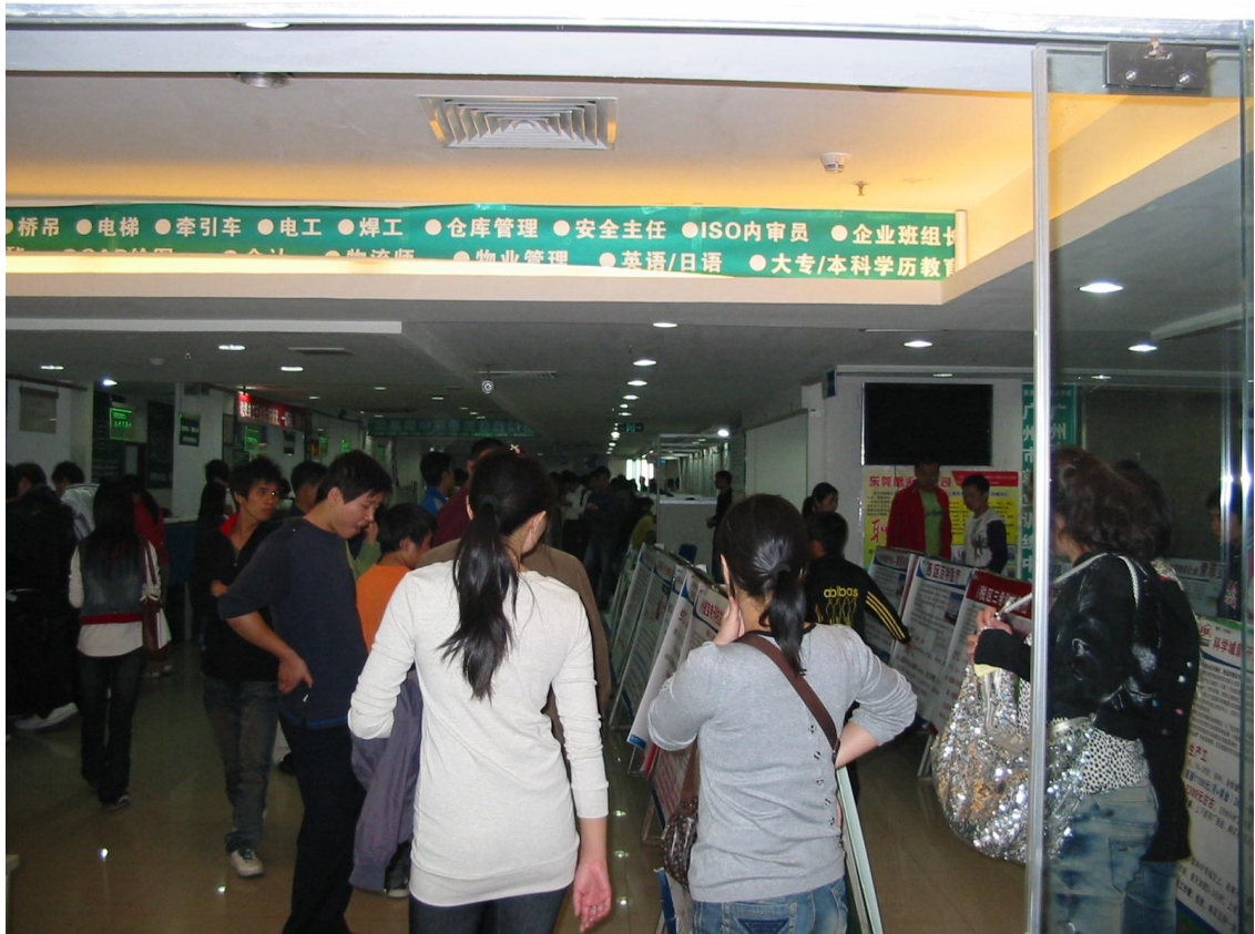
劳务公司内人山人海