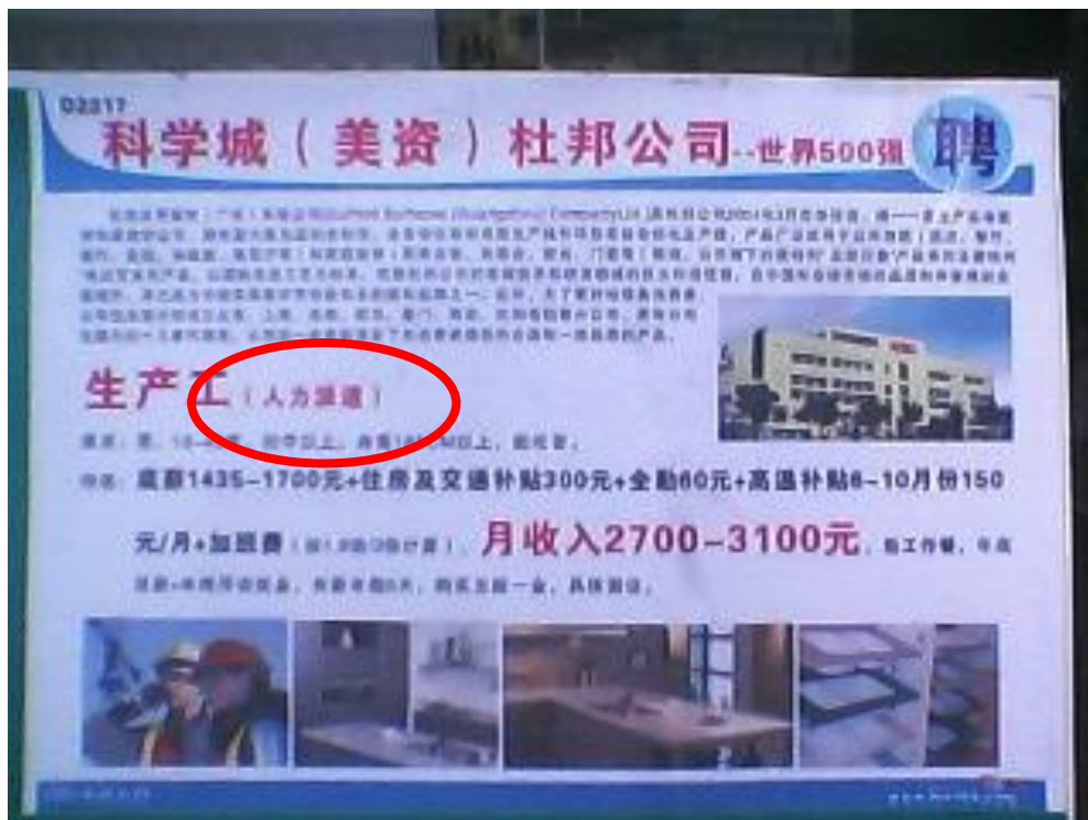
杜邦公司招聘生产工