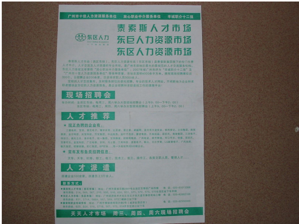
泰索斯招聘会的宣传单张