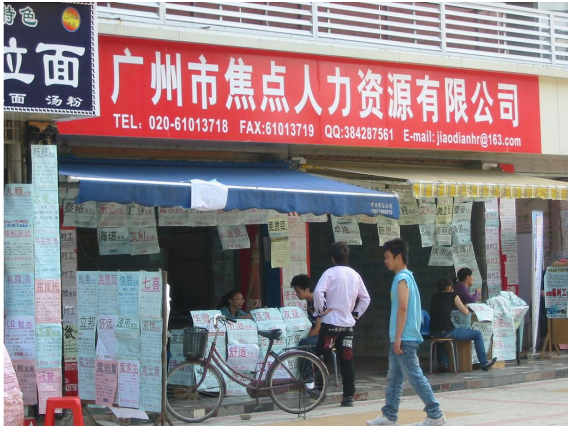
劳务公司会把招聘的信息张贴于门外，吸引找工作的途人