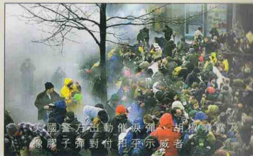
美國警方出動催淚彈、胡椒噴霧及橡膠子彈對付和平示威者。

1999年11月，世貿在西雅圖舉行貿易會議，約四、五萬名來自世界各地的群眾到來示威。美國的總工會勞聯產聯(AFL-CIO)更發動了近年罕見的三萬人大示威，抗議世貿的政策打破工人的飯碗和帶來更大的剝削。一部份示威者更索性在通往會場的道路靜坐，堅決不讓會議順利進行。會議在抗議浪潮中，狼狽地提前結束。