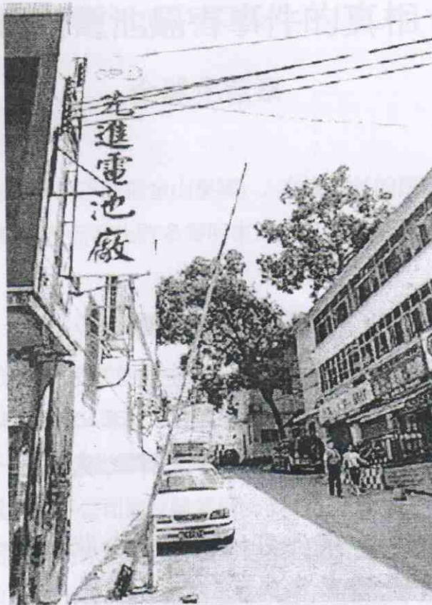
金山電池屬下的惠州先進廠

你有沒有使用超霸（GP）電池？超霸電池是香港十大名牌之一，它所屬的金山工業集團更是一間有 81 億資產的跨國公司。可是，它的成功卻建築在員工的健康上。